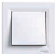
Łącznik 1-biegunowy, biały