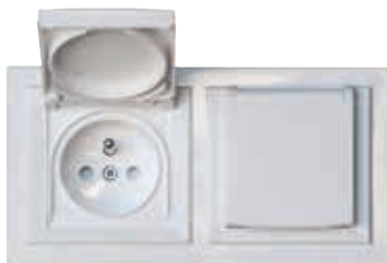
Gniazda 2P+PE IP44 w ramce podwójnej, białe