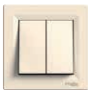
Łącznik świecznikowy, kremowy