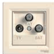
Gniazdo TV/SAT/SAT, kremowe