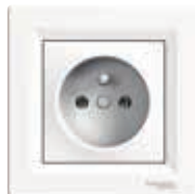
Gniazdo 2P+PE, białe