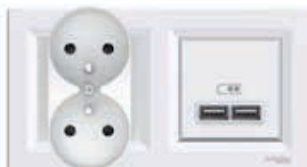
Gniazdo 2 x 2P+PE i gniazdo ładowania 2 x USB w ramce podwójnej, białe