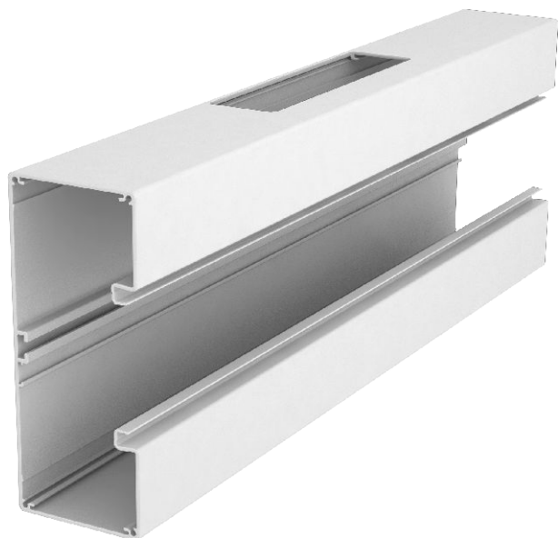
Trójnik do zmiany kierunków kanałów podparapetowych RapiD 80 GA.