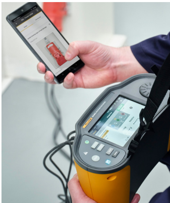
Przypisuj zdjęcia bezpośrednio do określonych punktów pomiarowych, aby sporządzać bardziej szczegółową dokumentację