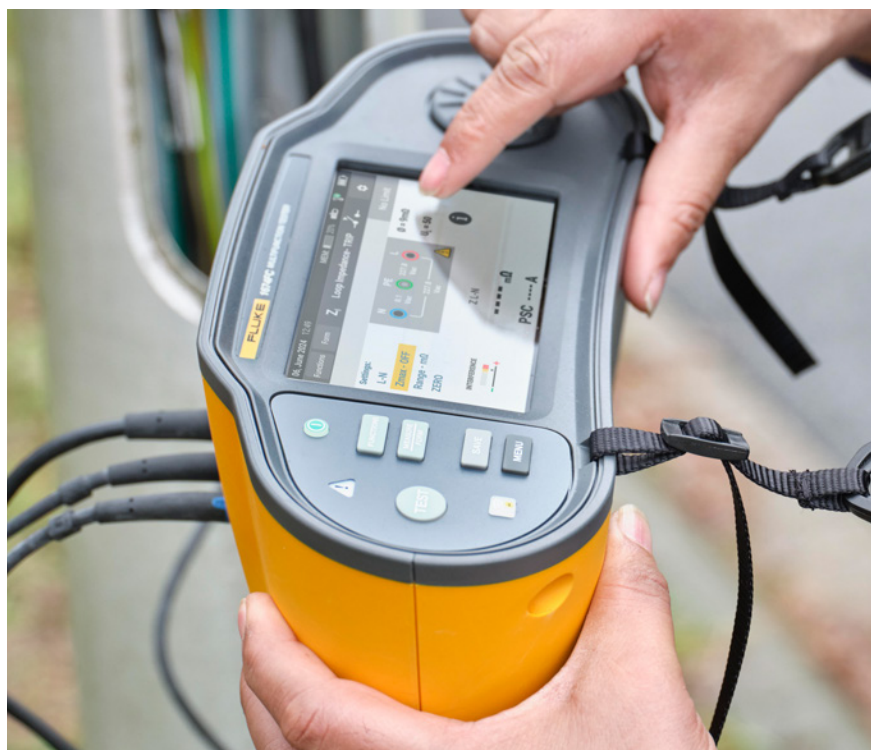
Kolorowy ekran dotykowy i pokrętko dotykowe umożliwiają szybką nawigację

Oprogramowanie Fluke TruTest™ upraszcza generowanie raportów dzięki funkcji automatycznego tworzenia raportów, integracji z systemem Fluke Connect i funkcji raportowania jednym przyciskiem.