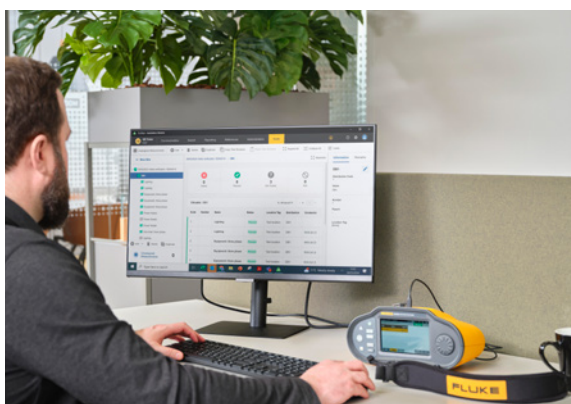
Oprogramowanie TruTest upraszcza zarządzanie danymi dotyczącymi instalacji elektrycznych i tworzenie raportów na ich temat

Oprogramowanie Fluke TruTest umożliwia tworzenie certyfikatów zgodnych z nieustannie poszerzaną listą raportów regionalnych, w tym z BS7671, DIN VDE 0100-600, ÖVE/ÖNORM E 8101, NIN/NIV, NEN3140 i innymi europejskimi normami testowania instalacji. Wszystkie te raporty są dostępne w zasięgu ręki. Wystarczy nacisnąć jeden przycisk, a wstępnie skonfigurowany międzynarodowy szablon w oprogramowaniu TruTest zapewni zgodność niezależnie od lokalizacji.