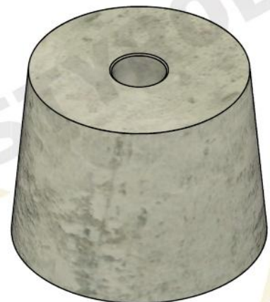
Fundament FOL 230 (230/260)