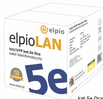
kat.5e Dca 500m