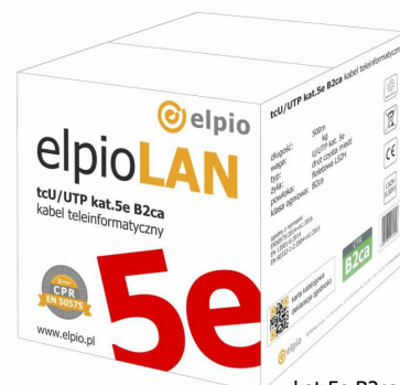
kat.5e B2ca 500m