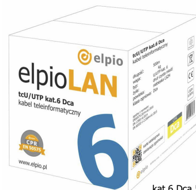
kat.6 Dca 500m