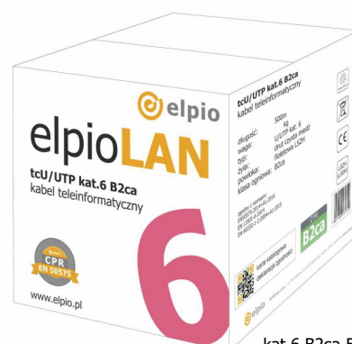
kat.6 B2ca 500m