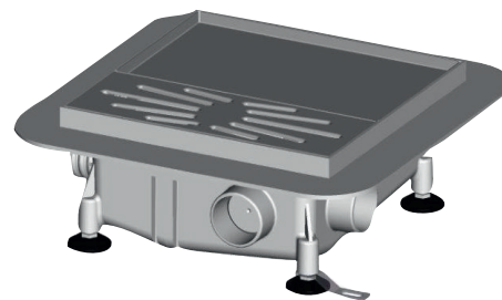
Kratka ściekowa z pompą Plancofix