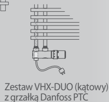
Zestaw VHX-DUO (kątowy) z grzałką Danfoss PTC