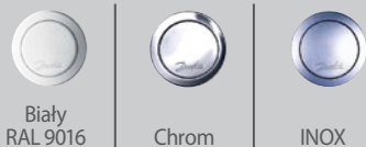
Biały RAL 9016 Chrom INOX