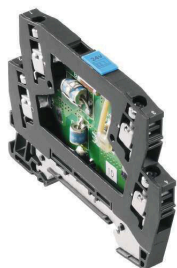
Podobny do przedstawionego na ilustracji