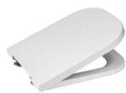
Deska wc Duroplast wolnoopadająca łatwowyypinalna