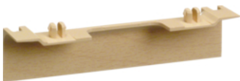
tehalit.SL Maskownica nośnika 20x55 fi60 klon