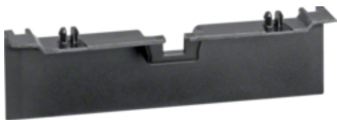
tehalit.SL Maskownica nośnika 20x80 czarny